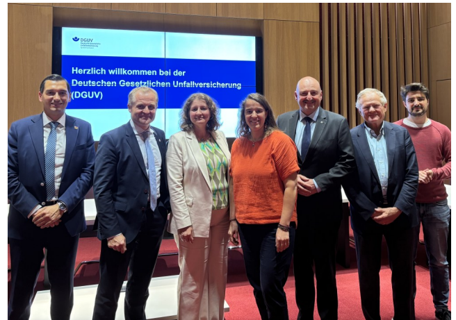
Sekretariat: Ausschuss für Arbeit und Soziales